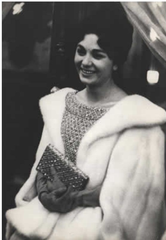
فرح دیبا در ایام نامزدي با محمدرضا پهلوي در اپر اي پاریس