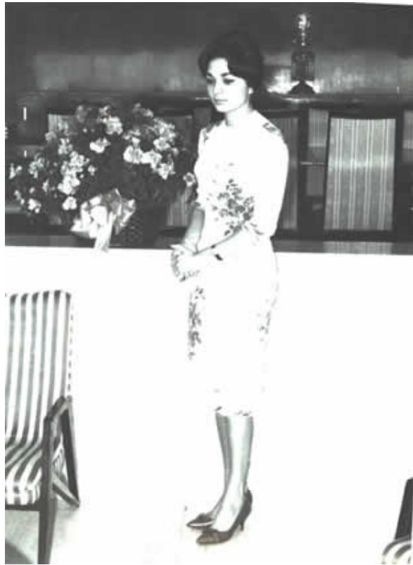
فرح ديبا در دوران نامزدي با محمدرضا پهلوي