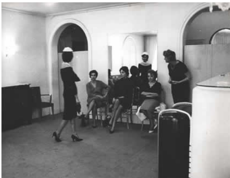
فرح ديبا به هنگام خريد لباس نامزدي در پاریس