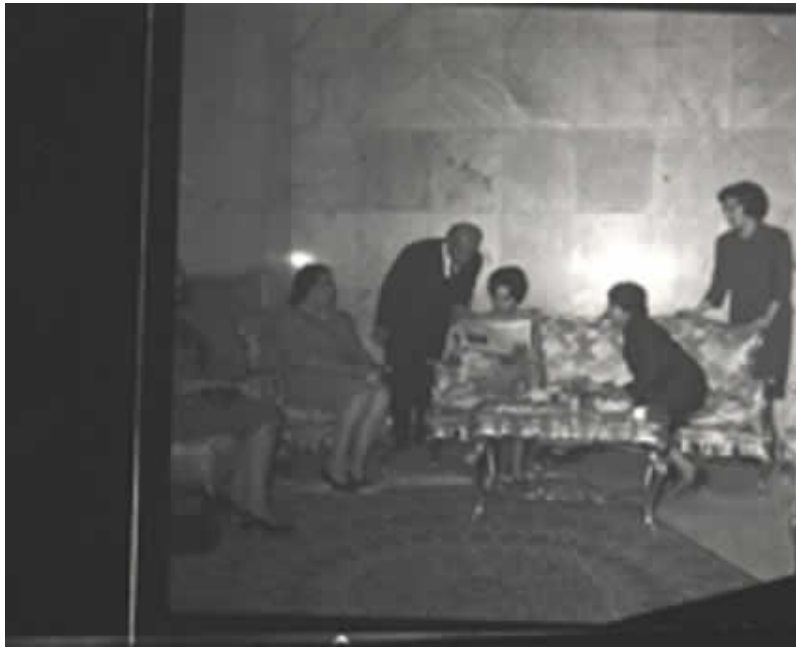
فرح دیبا به اتفاق چند تن از بستگان خود در حال مطالعه اخبار منتشره در نشریات در خصوص نامزدي وي با محمدرضا پهلوي از راست : 2. لوئیز قطبي 3. فرح دیبا 4. محمدعلي قطبي