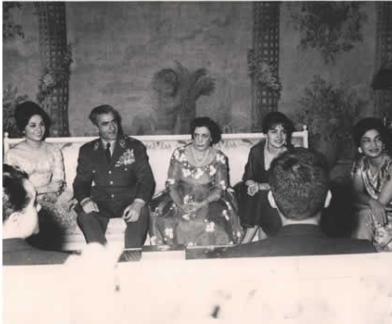
جشن نامزدي محمدرضا پهلوي و فرح ديبيبا در كاخ مرمر از راست: اشرف پهلوي، شهناز پهلوي، تاج الملوك پهلوي، محمدرضا پهلوي و فرح ديبيبا