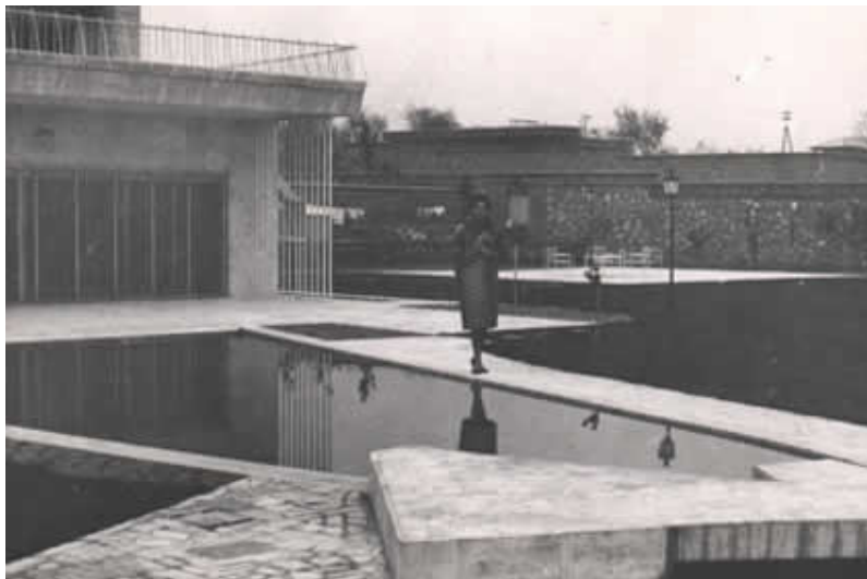
فرح ديبا در منزل دايي خود محمدعلي قطبي هنگام عزيمت به دربار و دیدار با محمدرضا پهلوي براي اولين بار