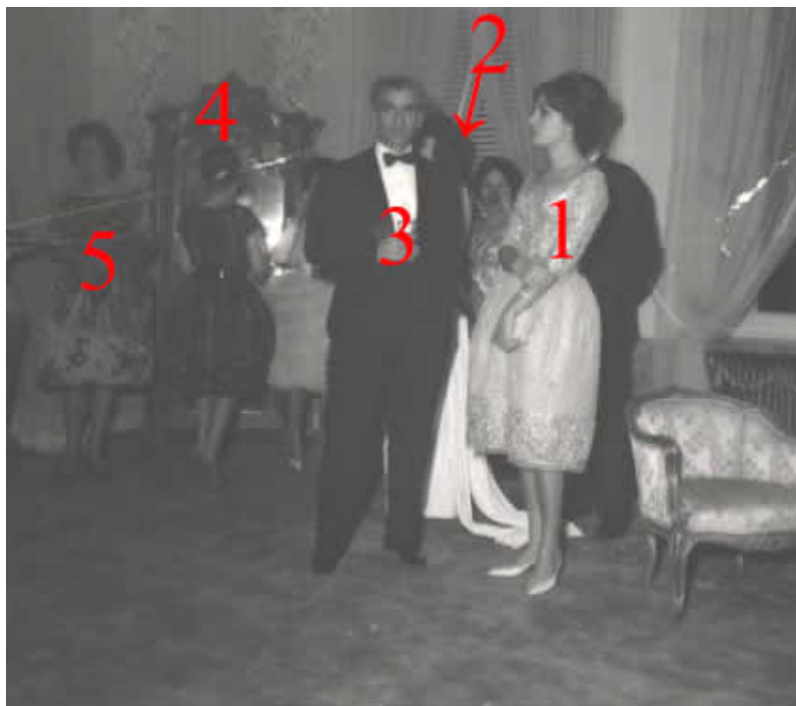
محمدرضا پهلوي و فرح ديبيبا در دوران نامزدي در مراسم جشن ازدواج فاطمه پهلوي و محمد خاتمي 1. فرح ديبيبا 2. فاطمه پهلوي 3. محمدرضا پهلوي 4. شهناز پهلوي 5. فريده ديبيبا