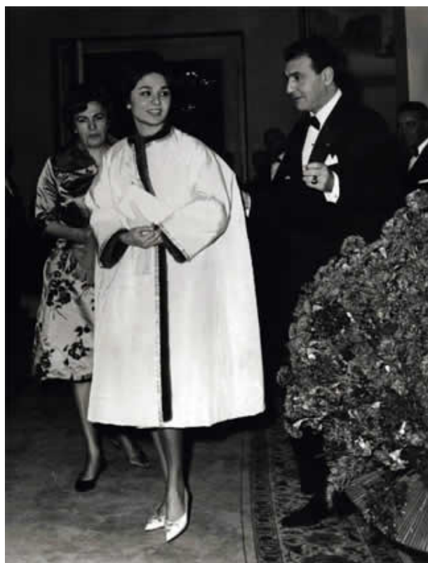
عزیمت فرح دیبا به کاخ مرمر برای شرکت در مراسم جشن نامزدي با محمدرضا پهلوي از راست: اردشیر زاهدي، فرح دیبا و فریده دیبا