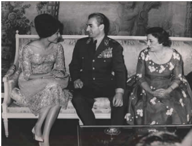
جشن نامزدي محمدرضا پهلوي و فرح ديبيبا در كاخ مرمر از راست: تاج الملوك پهلوي، محمدرضا پهلوي و فرح ديبيبا