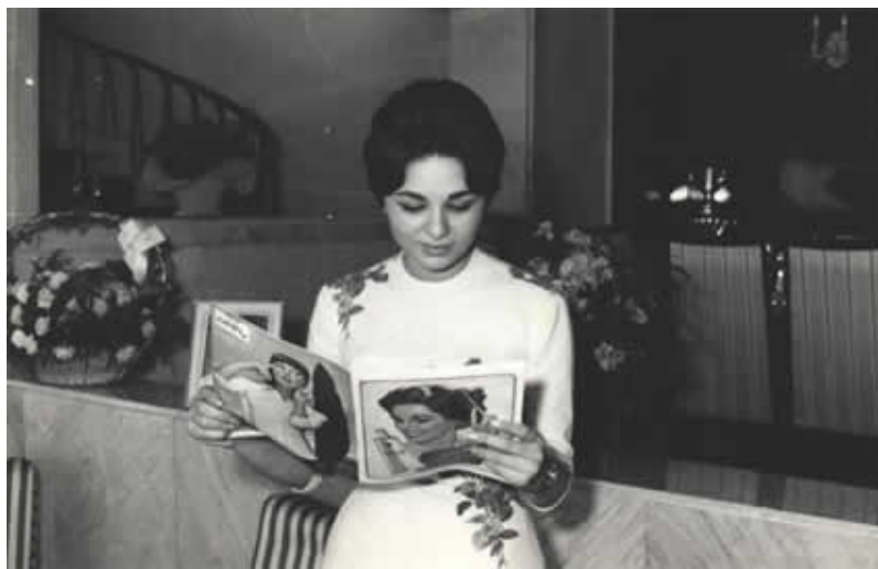
مصاحبه خبرنگار مجله اطلاعات بانوان با فرح ديبا در دوران نامزدي (1338/9/15)