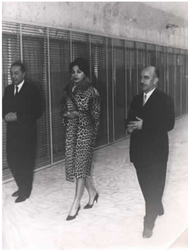
فرح ديبا به همراه محمدعلي قطبي و غلامعلي سيف ناصري هنگام عزيمت به دربار و دیدار با محمدرضا پهلوي براي اولين بار