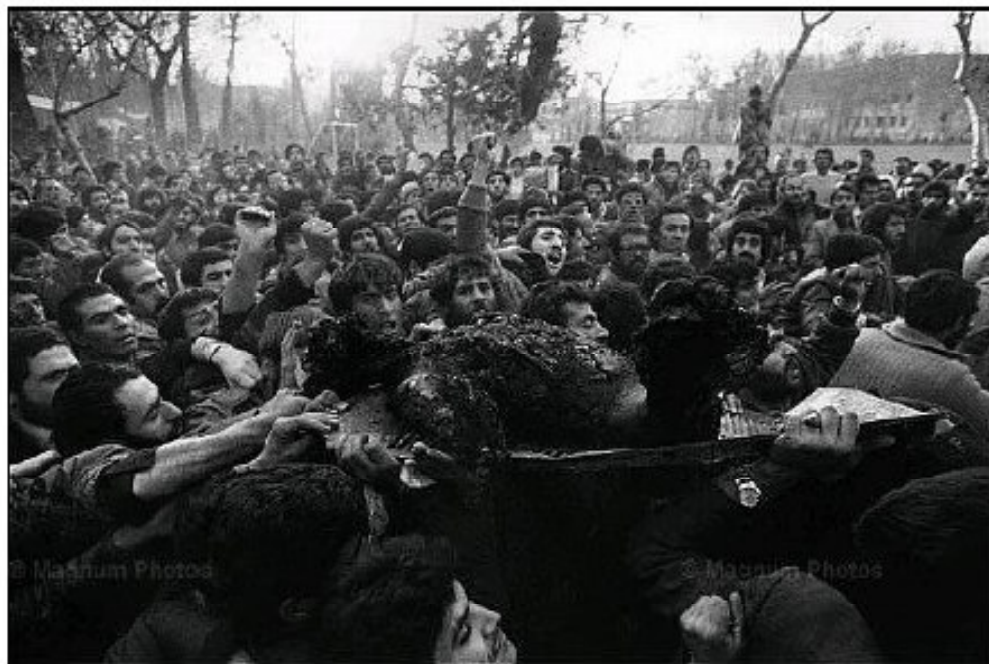
جنازه يك فاحشه پس از سوزانده شدن دي ۵۷