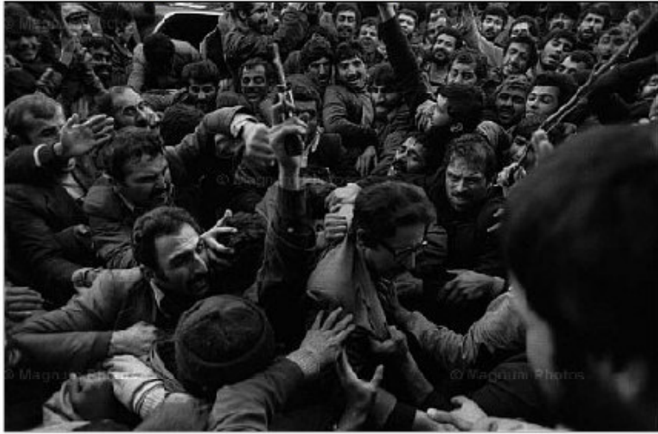
اولین رئیس جمهور انقلاب