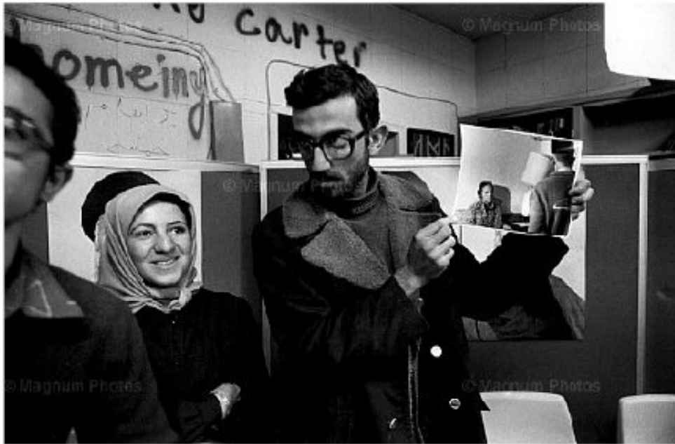
بیطرف و ابتکار، تسخیر سفارت آمریکا آبان ۵۸