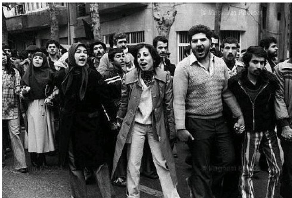
اطراف دانشگاه تهران آبان ۵۸