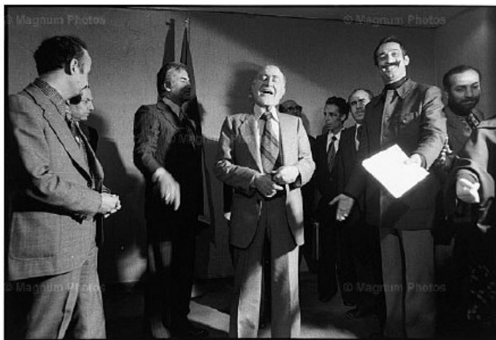
دولت موقت اسفند ۵۷